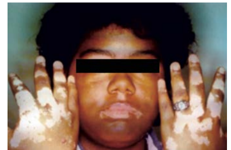
Gambar 1. Vitiligo Akrofasial 29

Vitiligo juga dapat terjadi pada bagian kulit yang mengalami trauma ( Koebner's phenomenon ). 28 Pada vitiligo dapat juga terjadi leukotrichia (depigmentasi rambut pada makula) angka kejadiannya sangat bervariasi (10%-60%); mungkin disebabkan oleh kerusakan reservoir melanosit pada folikel rambut, yang dapat menjadi penanda respons pengobatan akan kurang baik. 29